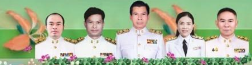
คณะผู้บริหาร